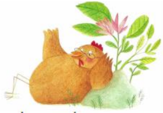
LA GROSSE POULE ROUSSE