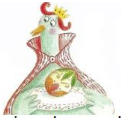
LA REINE DES POULES