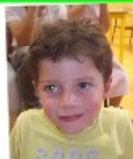
Gabriel vendredi 15