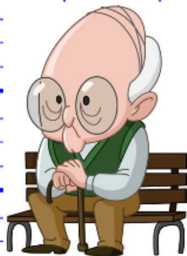
un vieux monsieur