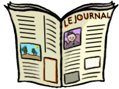
Lire le journal