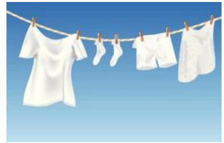
Laver les draps, les torchons...