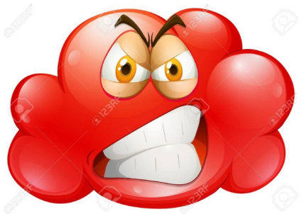
Se mettre très en colère