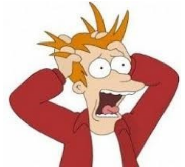
Créer des soucis à quelqu'un