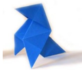
Pliage de papier