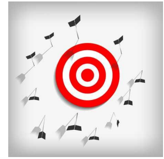
Ne pas réussir son coup