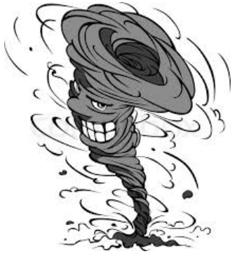
Être très fâché