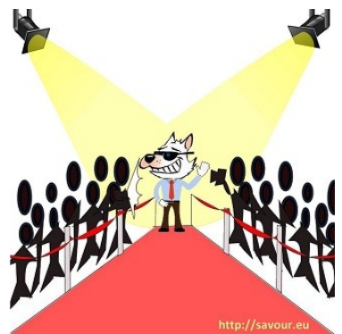
Etre très célèbre