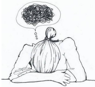
Broyer du noir