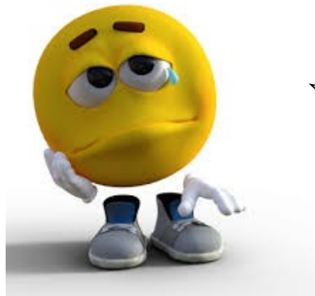
Mots de Noé