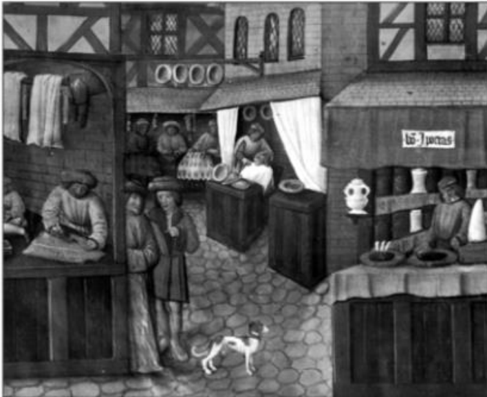
Une rue commerçante au XV e siècle

“Afin d’embellir notre ville de Dinan et pour le profit et l’utilité de tous, principalement des marchands, le maire, les échevins et toute la communauté de la ville ont élevé un édifice, communément appelé halle. [...] Tous ceux qui demeurent en ville et les étrangers qui y viendront vendre drap, toile, pain, mercerie, ou autres marchandises devront exposer et vendre leurs marchandises dans la halle.” Texte de la commune de Dinan, 1263.