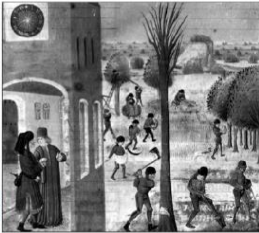
Les travaux des champs (miniature de Pierre de Crescent, XV e siècle)

Les paysans travaillent sur les terres du seigneur qui les protège. En échange, les paysans paient au seigneur des redevances et lui doivent des journées de travail.