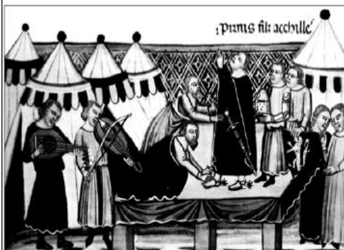
L'adoubement (miniature du XIV e siècle)

Pour se défendre et pour protéger villageois et paysans, les seigneurs construisent des châteaux forts. En cas de guerre, ils appellent à l'aide les chevaliers qui leur ont juré fidélité.