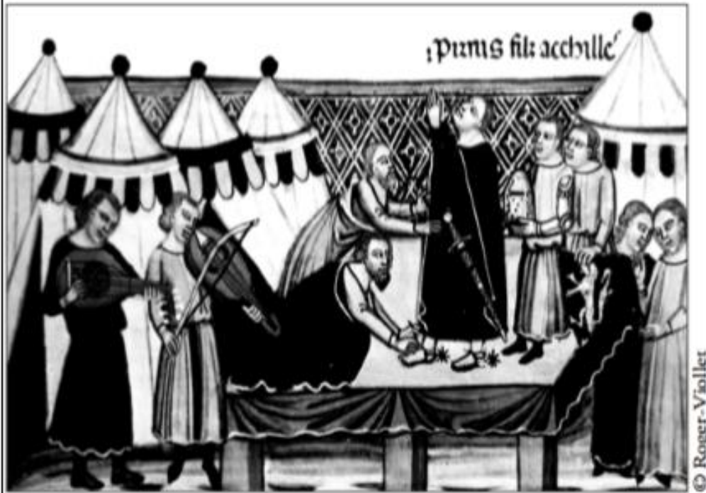
L'adoubement (miniature du XIV e siècle)

Pour se défendre et pour protéger villageois et paysans, les seigneurs construisent des châteaux forts. En cas de guerre, ils appellent à l'aide les chevaliers qui leur ont juré fidélité.